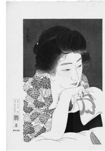
ภาพ Morning Hair (朝寝髪)

ความจริงจ๊อบส์รู้จักงานชินฮันงะมาตั้งแต่วัยรุ่น เพราะบ้านของเพื่อนวัยเด็ก (และต่อมาเป็นผู้ร่วมงานของเขา) บิล เพอร์นานเดซ